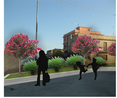
b) aiuola in Via Paraspore