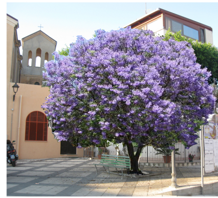
a) Jacaranda in Piazza Giovanni Paolo